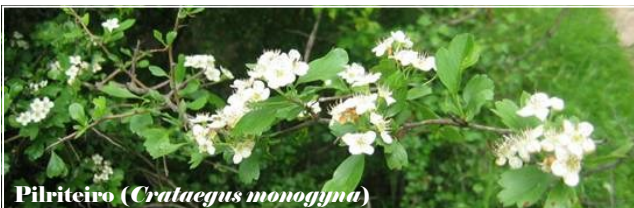
Pilriteiro ( Crataegus monogyna )

No sentido de proteger a biodiversidade e as áreas mais importantes para a conservação das espécies ameaçadas foi definido, ao nível Europeu, a Rede Natura 2000. Neste âmbito, foi criado o sítio Sicó-Alvaiázere, pela Resolução do Conselho de Ministros n.º 76/00, de 5 de Julho, que tem uma área total de 31 678 hectares, dos quais 17% pertencem ao Concelho de Pombal. Este sítio possui uma elevada diversidade de habitats associados ao calcário.