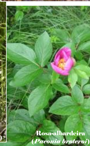
Rosa-albardeira ( Paeonia broteroi )