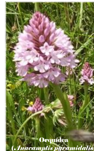
Orquídea ( Anacamptis pyramidalis )