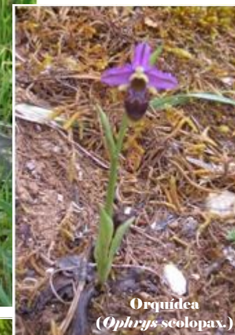
Orquídea ( Ophrys scolopax )