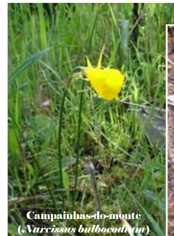
Campainhas-do-monte ( Narcissus bulbocodium )