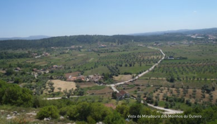
Vista do Miradouro dos Moinhos do Outeiro