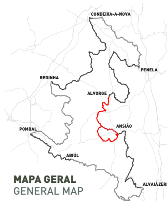
MAPA GERAL GENERAL MAP

Upon reaching the paved road, one follows towards the river, continuing through the forest path up to Escampado da Lagoa. At the village entrance, the route takes a small detour to the left in order to get around the small valley that that was the origin of the name of the place. About 2 km after, the stage ends in Ansião.