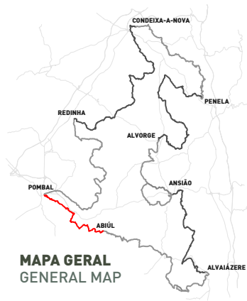
MAPA GERAL GENERAL MAP

The trail ends at a paved road which then descends a few meters before ascending by a pedestrian trail that goes onto the Cumeira common lands. Upon reaching the top, the route follows the ridge towards Pombal, passing through the Rola Woods and climbing to the Templar Castle of Pombal to then visit the historical area: Old Clock Tower, Marques de Pombal Square (Main Church, the Barn and the Prison), ending near the Town Council at Tílias Garden (Cardal Church and Santo António Convent).