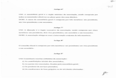
image003.jpg 28 KB