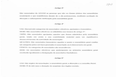
image004.jpg 33 KB