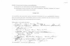
image002.jpg 35 KB