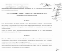
image001.jpg 41 KB

DOIS: É de três anos a duração do mandato dos órgãos sociais.