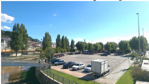
Figura 6: Largo do Arnado