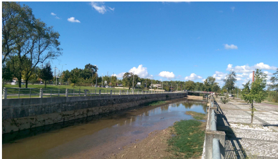
Figura 2: Jardim das Cegonhas (1ª fase)