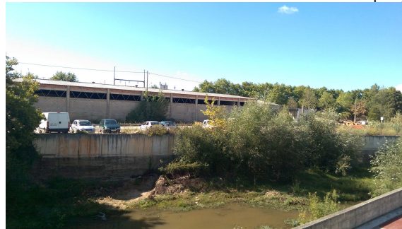
Figura 3: Jardim das Cegonhas (2ª fase - Antigas oficinas municipais)