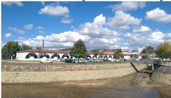
Figura 4: Central de camionagem