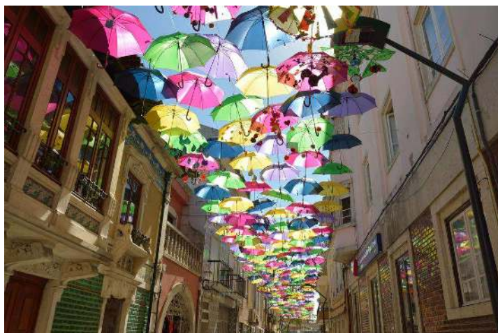
Chegada da Primavera