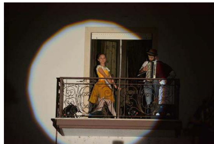
Abril, mês da dança